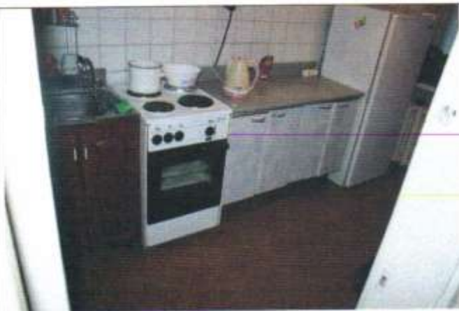
ФОТО 28 ЖИЛОЕ ПОМЕЩЕНИЕ КУХНЯ