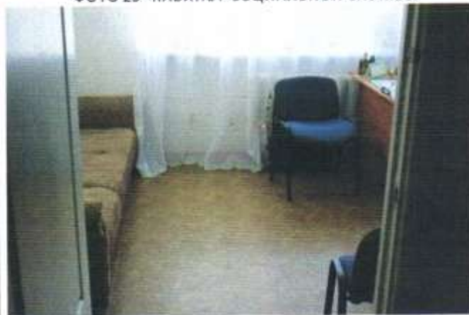
ФОТО 24 КАБИНЕТ ПСИХОЛОГА