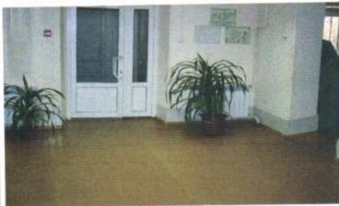
ФОТО 12 ВХОД

3. Путь (пути) движения внутри здания (в т.ч. пути эвакуации)