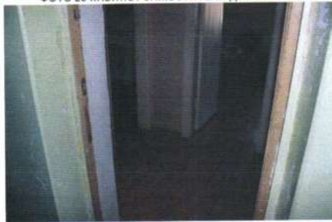
ФОТО 27 ЖИЛОЕ ПОМЕЩЕНИЕ