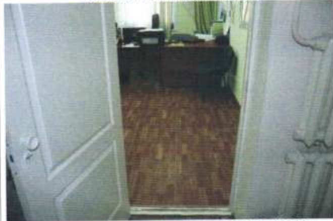
ФОТО 26 КАБИНЕТ ЗАМЕСТИТЕЛЯ ДИРЕКТОРА