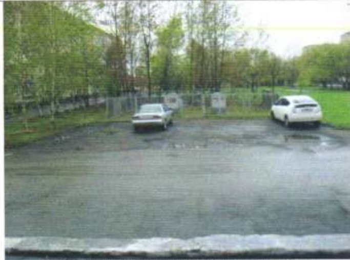
ФОТО 33 ПАРКОВКА НА ПРОТИВ УЧРЕЖДЕНИЯ

7. Пути движения к объекту (от остановки транспорта)