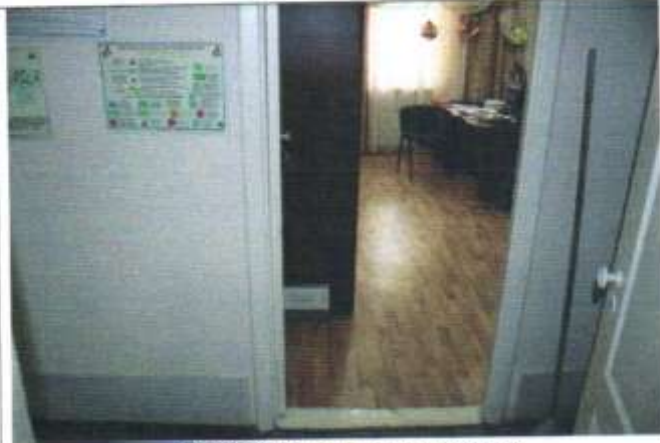
ФОТО 25 КАБИНЕТ ДИРЕКТОРА