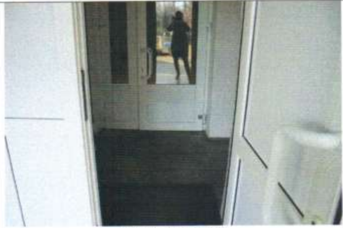
ФОТО 11 ТАМБУР