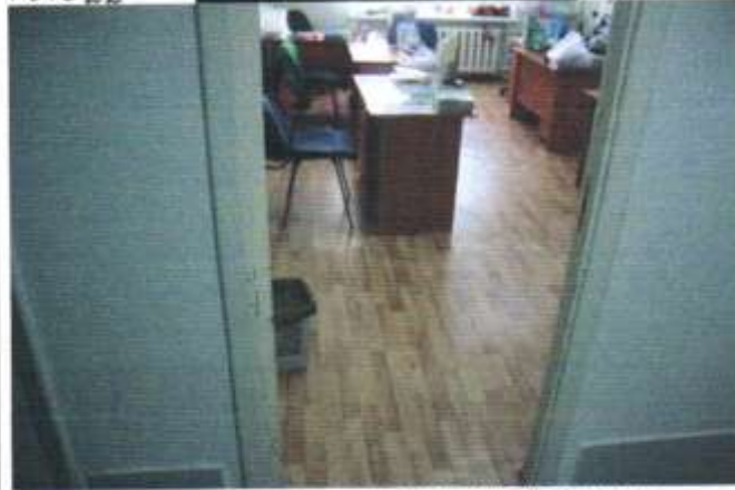
ФОТО 23 КАБИНЕТ СОЦИАЛЬНОЙ СЛУЖБЫ