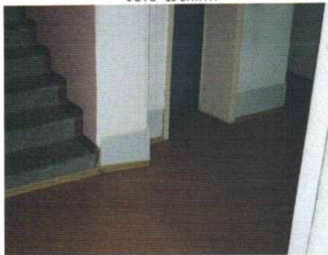
ФОТО 14 ЛИФТ 1